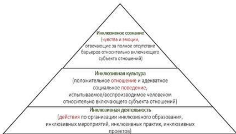
Рисунок. - Иерархия развития инклюзии в обществе [1]

У ученых разных направлений науки инклюзивное образование инвалидов находится в постоянном поле зрения. Есть фундаментальные труды социологов, психологов, педагогов и др. направлений науки, которые всесторонне и кропотливо изучают проблемы обучения детей и взрослых, в основном, имеющих инвалидность, или ограниченные возможности здоровья (ОВЗ).