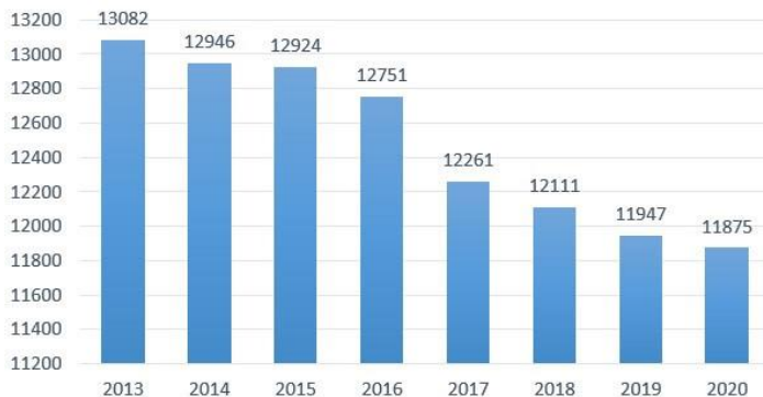
Рисунок 1. – Снижение количества инвалидов к 2020 году [16]

На рисунке 1 более наглядно показано, что к 2020 году хоть и наблюдается снижение числа инвалидов (рис. 1), все же их количество вызывает тревогу [15]: