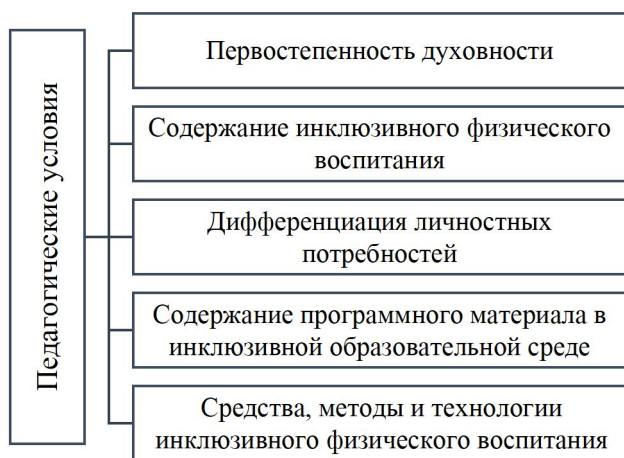
Рисунок. Педагогические условия содержания образования в сфере физической культуры на основе инклюзивного подхода (И.В. Клименко (2024)).

Результаты анализа, интерпретация и обобщение в ходе выделения ряда педагогических условий представлены на рисунке.