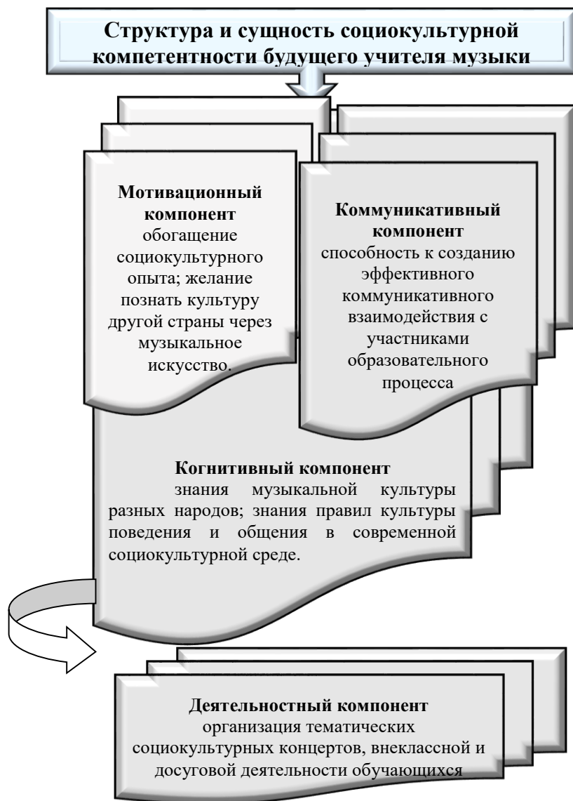
Рисунок 2. Сущность и структура социокультурной компетентности будущего учителя музыки