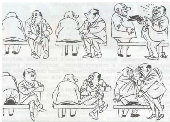
Рис. 2. Х. Бидstrup (Дания). Иллюстрация различных типов темпераментов (относится к табл. 3)

В учебнике представлено свыше 20 подобных иллюстраций, каждая из которых несет оригинальную смысловую нагрузку и помогает лучше осознать текстовый материал, поскольку активизирует чувственно-эмоциональную сферу [11]. Ниже представлены примеры таких иллюстраций (по одному на каждую тему) в сочетании с желательными выводами обучающихся, к которым они приходят при умелом обсуждении сюжетов картин (рисунков) на уроке. Одну из таких иллюстраций мы нашли целесообразным привести в тексте статьи (см. рис. 2).